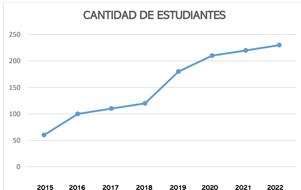
GRÁFICO REPRESENTATIVO DE CRECIMIENTO.

Se considera importante en esta reseña presentar un cuadro representativo de crecimiento del establecimiento, ya que este ha sido un punto que se debe evidenciar en estos primeros años de vida.